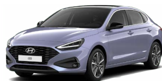
Meta Blue Pearl Perleťová Cena: 16 900 Kč