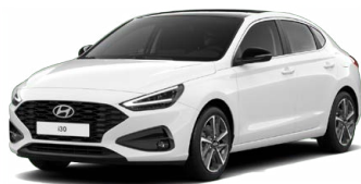
Atlas White Pastelová Cena: 5 900 Kč