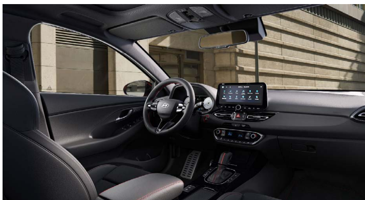
Černý interiér N line – látkové čalounění s červeným prošíváním a logem N – černé čalounění stropu a obložení bočních sloupků – červeně prošívání sportovní volant, hlavice řadící páky a loketní opěrka