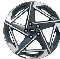
18" kola z lehké slitiny – N Line