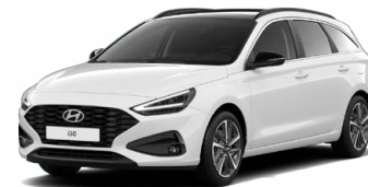
Serenity White Pearl Perleťová Cena: 16 900 Kč