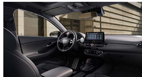
Černý interiér N line – látkové čalounění s červeným prošíváním a logem N – černé čalounění stropu a obložení bočních sloupků – červeně prošívání sportovní volant, hlavice řadící páky a loketní opěrka