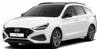
Atlas White Pastelová Cena: 5 900 Kč