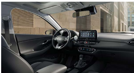
Černý interiér Oceanidis Black Premium – kožené čalounění sedadel – světlé čalounění stropu a obložení bočních sloupků – černé provedení přístrojové desky a výplní dveří