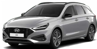
Shimmering Silver Metallic Metalická Cena: 16 900 Kč