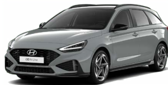
Shadow Gray Pastelová Cena: 16 900 Kč Dostupná pouze pro výbavy N Line