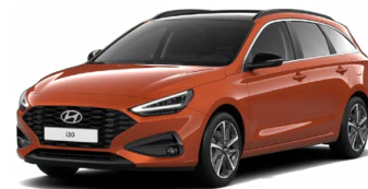
Jupiter Orange Metallic Metalická Cena: 16 900 Kč