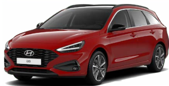
Engine Red Pastelová Cena: 0 Kč