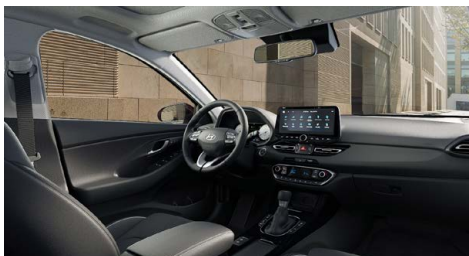
Černý interiér Oceanidis Black Premium – kožené čalounění sedadel – světlé čalounění stropu a obložení bočních sloupků – černé provedení přístrojové desky a výplní dveří