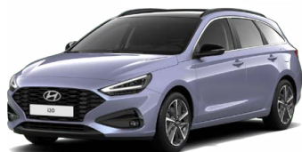
Meta Blue Pearl Perleťová Cena: 16 900 Kč