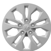
15" ocelová kola s celoplošnými kryty