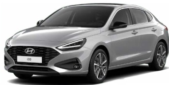
Shimmering Silver Metallic Metalická Cena: 16 900 Kč