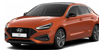
Jupiter Orange Metallic Metalická Cena: 16 900 Kč