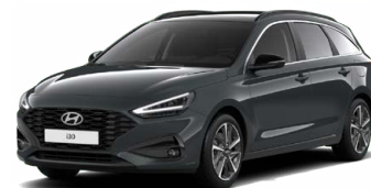
Cypress Green Pearl Perleťová Cena: 16 900 Kč