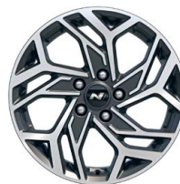
17" kola z lehké slitiny – N Line