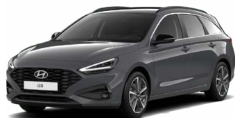
Ecotronic Gray Pearl Perleťová Cena: 16 900 Kč