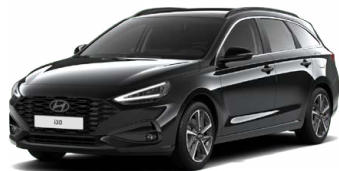
Abyss Black Pearl Perleťová Cena: 16 900 Kč