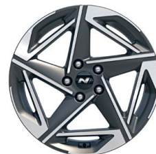
18" kola z lehké slitiny – N Line