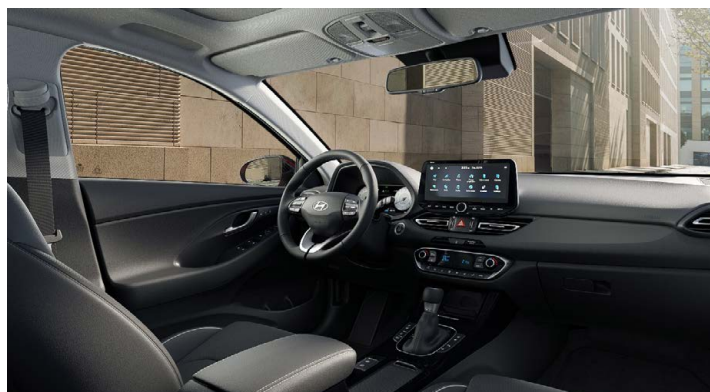
Černý interiér Oceanic Black Premium – kožené čalounění sedadel – světlé čalounění stropu a obložení bočních sloupků – černé provedení přístrojové desky a výplní dveří