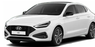
Serenity White Pearl Perleťová Cena: 16 900 Kč